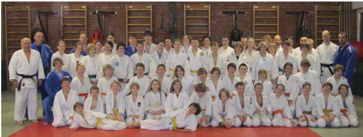
Teilnehmer der „Offen Matte“ am 26.02.2010 in Pirna

An dieser Stelle ein großer Dank an die mit der Ausrichtung der „Offenen Matte“ betrauten Vereine, deren Sportler und Trainer.